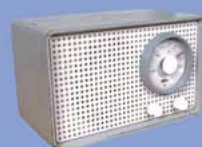
Radiogerät, Braun Kleinsuper SK2, 1955-1960

Unter die Erde führt eine weitere Station. Hier erfahren Sie, was unter dem Asphalt zur Sicherstellung der Stromversorgung notwendig ist.