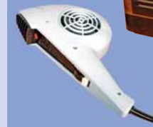
Fernsehergerät, Philips TX390i, 1948/49 und Haartrockner, AEG, 1964

Weiter geht's – und 45 Jahre zurück. Die Station „Haushalt 1960“ zeigt, dass der Strom zu dieser Zeit den privaten Alltag erreicht hat. Typische Objekte aus allen Lebensbereichen stehen für diese Entwicklung. Der Blick in Wohnzimmer und Küche beweist: Mixer, Bügeleisen und Fernseher gehören längst zum Inventar.